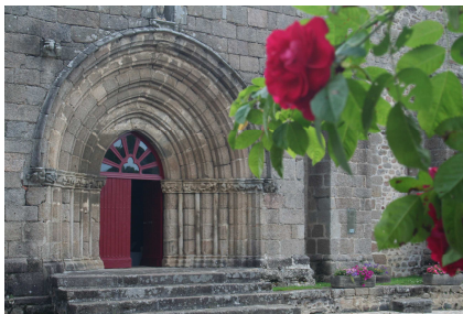
◀ Le portail de l'église

1 - Eglise Sainte-Marie (XI e XV e s.) - Elle est remarquable par la frise (XV e s.) de son beau portail limousin.