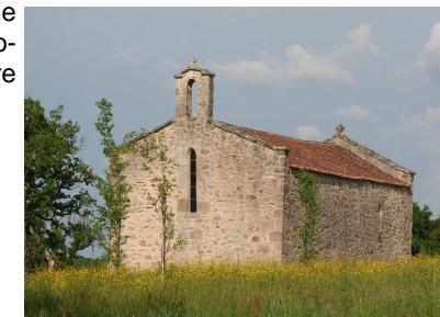
La chapelle Saint-Jean-Baptiste ▶

La Chapelle Saint-Jean-Baptiste (XIII e s.) apparaît au sommet de la crête. Elle était desservie par un ancien chemin de Limoges. Le petit campanile a perdu sa cloche. La charpente du XIII e s. a justifié l'inscription de l'édifice à l'Inventaire supplémentaire des MH. Autour, des fouilles archéologiques ont mis en évidence une aire artisanale gallo-romaine et un cimetière des XV e -XVII e s.